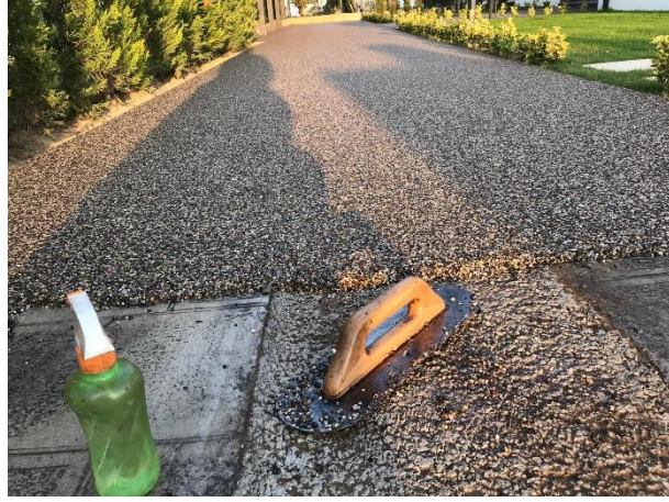
Şekil 4 Fox Stonecarpet® PU Agregası Karışımı Uygulaması