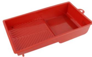
Şekil 5 Astar/boya teknesi

Not: Stonecarpet Binder Pu poliüretan reçine esaslı olmasından dolayı uygulama sırasında mala üzerinde reçine kalabilir. Mala üzerinde kalan reçinenin temizlenmesi uygulamanın kolay olmasını ve ürünün daha rahat işlenebilmesini sağlamaktadır. Bu yüzden mala FOX STONECARPET/PEBBLEDECK TROWEL CLEANER ile düzenli olarak temizlenmelidir.