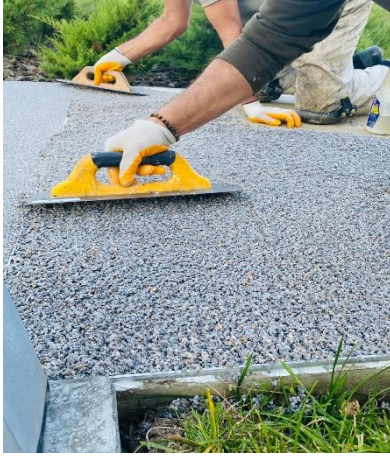
Şekil 3 Fox Stonecarpet® PU Agregası Karışımı Uygulaması

Hazırlanan karışımı uygun mala veya mastar ile uygulayın. Perdah makinesi kullanılarak tepsi perdahlama yapılabilmesi için uygulama yapılacak yüzeyin helikopterin ağırlığını taşıyabilecek kıvama ulaşması veya ayak izi derinliğinin maksimum 0,5 cm olması gerekmektedir. FOX STONECARPET® zemin kaplaması uygulanan yüzey minimum 12 saat (hava koşullarına göre 24 saat) sonra trafiğe açılabilir.